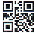
附件 1: 项目清单